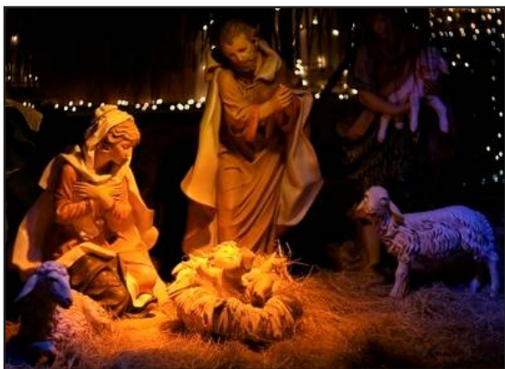
Betlém (jesličky) - umělecké vyobrazení jak právě narozený Ježíš leží v nuzném chlévě na seně v jesličkách.

Miliony lidí na celém světě slaví každoročně nejkrásnější svátek celého roku – Vánoce. Už ve starověku lidé v těchto dnech oslavovali návrat slunce, kdy se délka dne po zimním slunovratu (21.12.) opět začne prodlužovat. Křesťanská církev tyto oslavy označila za pohanské a ve 4. století je nahradila oslavou Narození Páně. Od těch dob se Vánoce považují za křesťanský svátek.