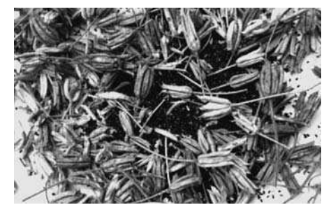
Není v naších silách dopřát Vám obrázky v nejvyšší kvalitě, proto tyto budou po vydání Zpravodaje k dispozici na vývěsce OÚ Veselice.